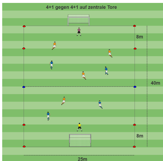
Abbildung 1: Spielfeldaufbau